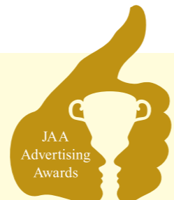
消費者が選んだ 広告コンクール

JAA 広告賞は、生活者視点から優れた広告を表彰することを通じて、時代に即したコミュニケーションのあり方を模索し、広告の健全なる発展に寄与することを目的に開催しています。数ある広告賞の中でも広告の受け手である消費者が実感に基づいて審査するという世界でも類を見ない大きな特徴を持つ総合広告賞です。